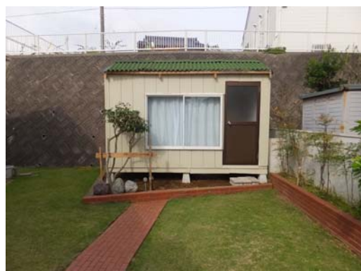
完成写真 ドアの向きを変更しました